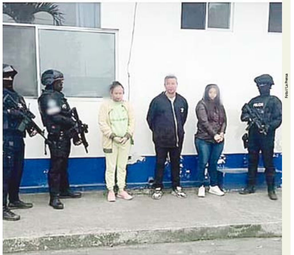
La policía detuvo a nueve personas en un operativo en Santo Domingo.

Con el operativo se evitó que seis millones de dosis de droga sean repartidas en el país.