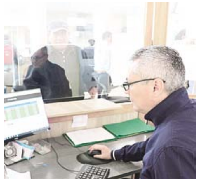
Los pagos deben realizarse 24 horas antes del turno.

» SALUD. BEBIDAS ENERGÉTICAS Y SUS RIESGOS EN EL BIENESTAR.