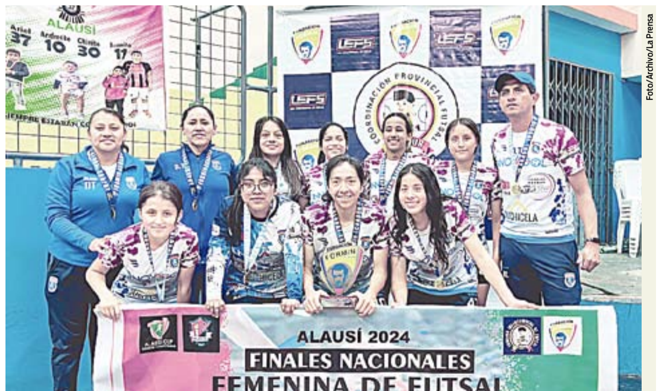
El conjunto de Innovagol que logró el título en el Torneo Femenino de Fútbol.

semana atrás, Innovagol logró el campeonato nacional en la