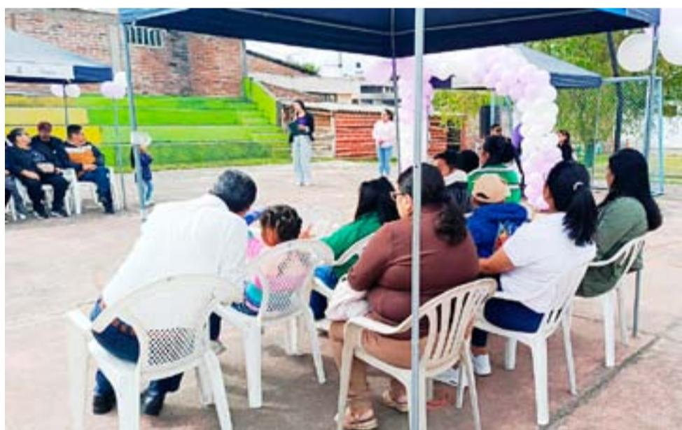
MIES ha sido un ejemplo de cómo las políticas públicas pueden transformar vidas