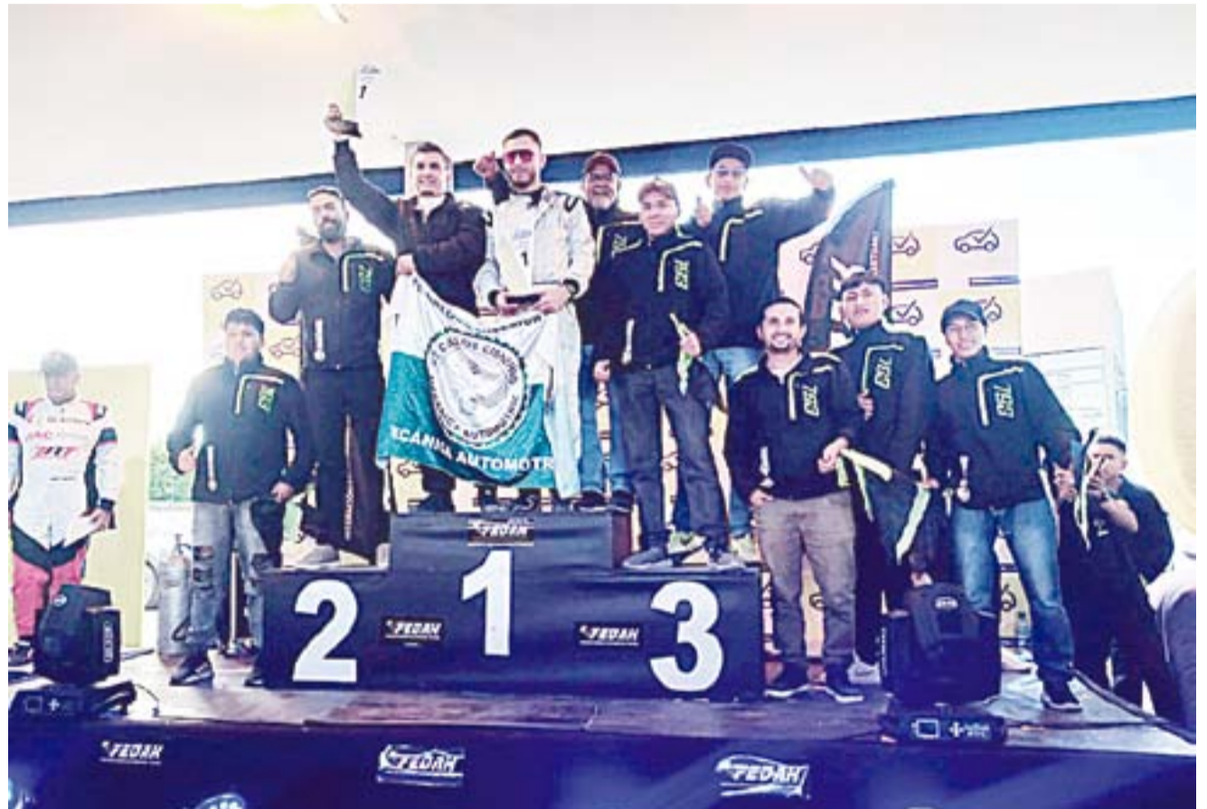
La Tripulación del ITES Carlos Cisneros en lo más alto del pódium del automovilismo ecuatoriano.

“Toda la vida yo he sido aficionado a lo que es las competencias, no sólo de autos, también en el moto-