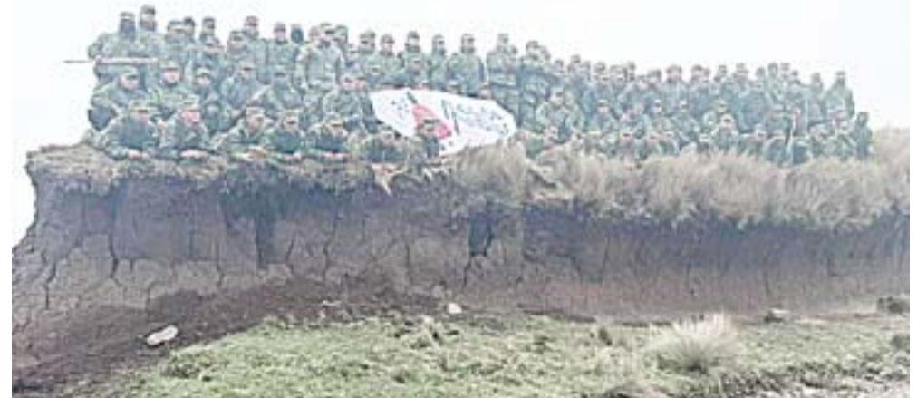
Brigada de Caballería N.º 11 Galápagos.

Andean Adventures reafirma su compromiso con la protección y recuperación de los ecosistemas de la provincia, y sigue demostrando que con esfuerzo, colaboración y un sueño compartido, se pueden lograr grandes transformaciones en beneficio del medio ambiente.