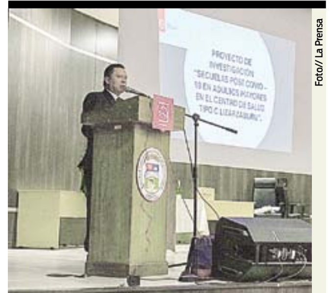
Secuelas Post Covid-19 en adultos mayores.