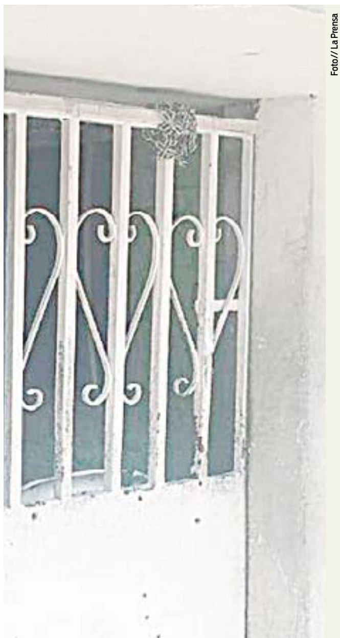
Los sicarios dispararon más de 37 veces contra la casa de la hoy fallecida, además dejó un herido.

» SE PRESUME QUE ES EL RESULTADO DE DISPUTA ENTRE DOS GRUPOS CRIMINALES