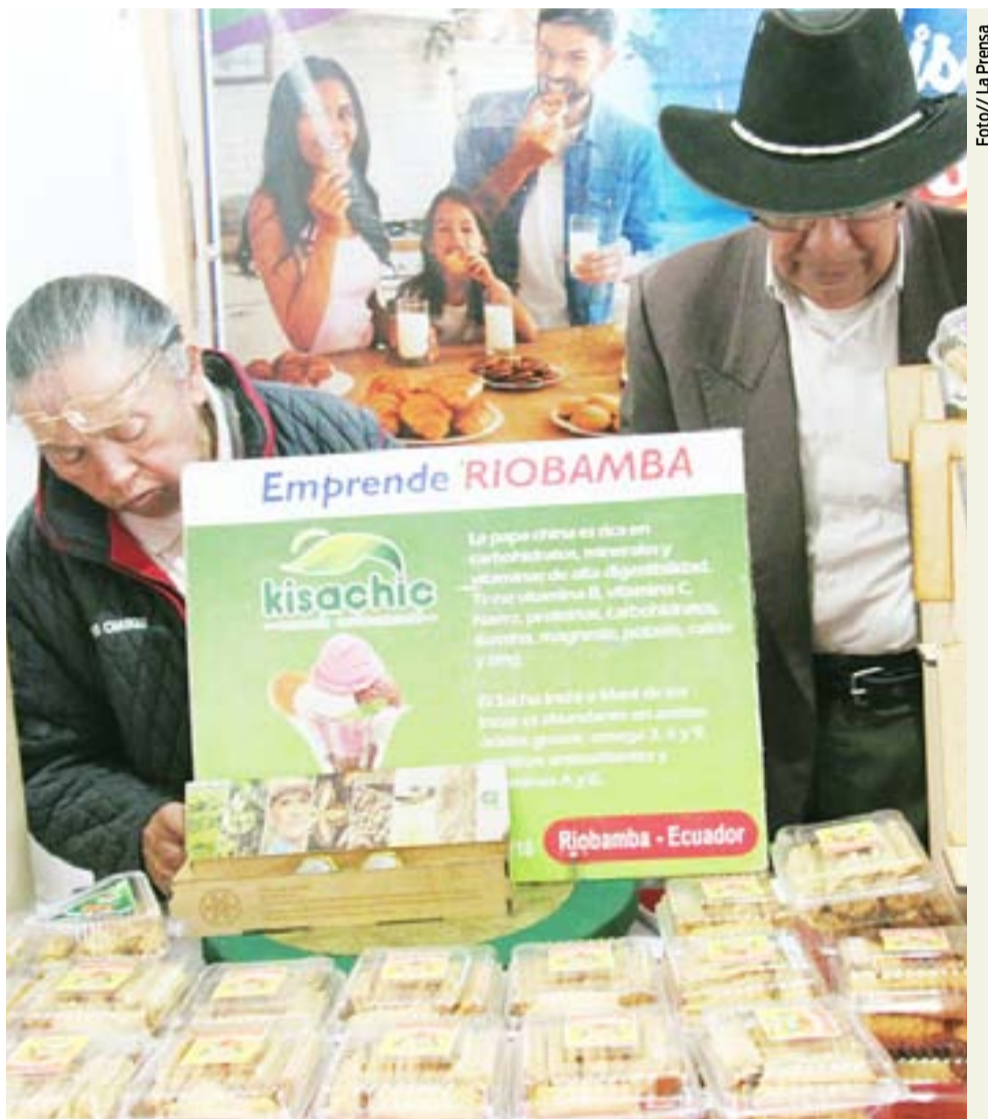
Activa participación en la feria que dinamizó la economía de los riobambenos.

En esta ocasión el ingreso a la feria no tuvo costo. Además, el alcalde resaltó los eventos como el Chascarrillo mual.