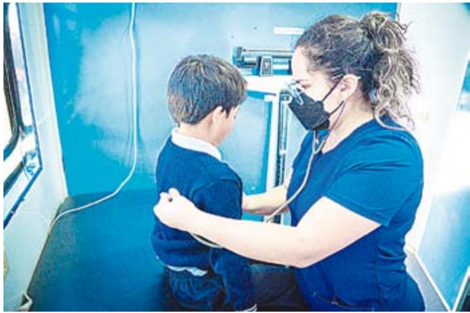
Personal médico especializado.

Este lunes 2 de diciembre, el equipo médico del Furgones de la Salud visitó la comunidad Corazón de Jesús, en la parroquia San Luis, donde brindó atención a 42 niños y niñas de la escuela Corazón de Jesús.