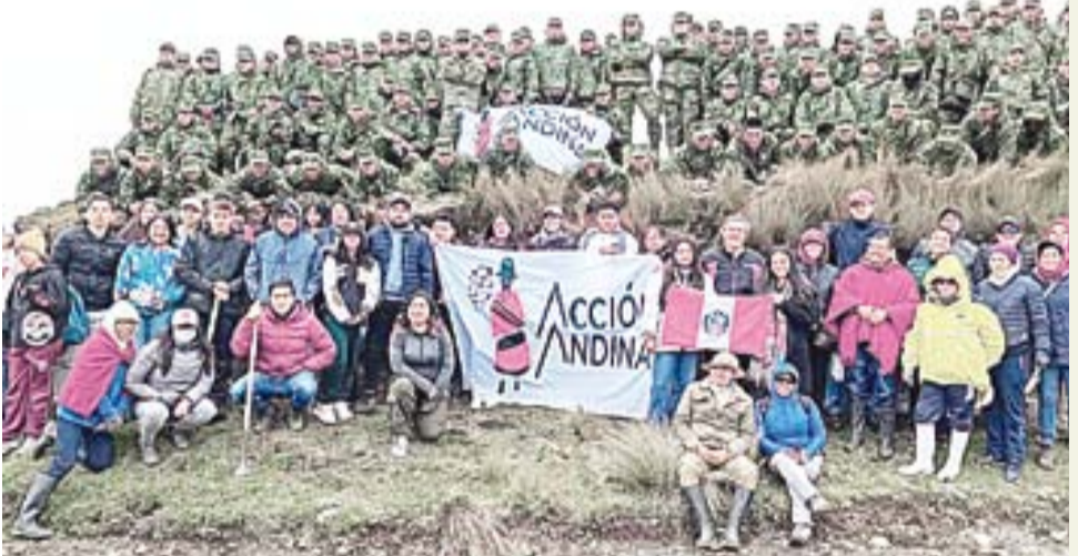
Estudiantes, comuneros y Brigada de Caballería N.º 11 Galápagos.

RIOBAMBA/ El viernes 29 de noviembre, en el páramo de Navaj, ubicado en las Huacónas Coto Juan, cantón Colta en Riobamba.